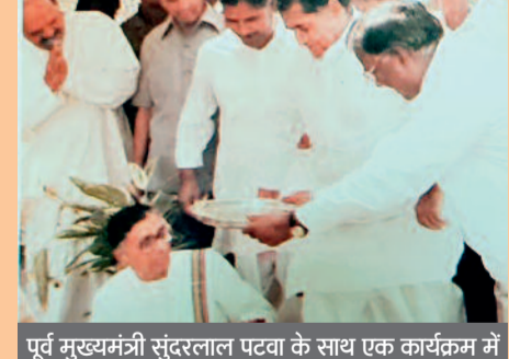
पूर्व मुख्यमंत्री सुंदरलाल पटवा के साथ एक कार्यक्रम में