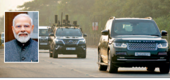
वीवीआईपी के आगमन से पूर्व गुरुवार को हुआ पूजाकार्य

यह सम्मेलन वरिष्ठ पुलिस नेतृत्व और सुरक्षा प्रशासकों को राष्ट्रीय सुरक्षा से जुड़े विविध मुद्दों पर खुलकर चर्चा करने का महत्वपूर्ण मंच प्रदान करता है। इसमें अपराध नियंत्रण, कानून-व्यवस्था बनाए रखने, आंतरिक सुरक्षा चुनौतियों से निपटने, पुलिस ढांचे और कर्मचारियों से जुड़ी समस्याओं पर विचार-विमर्श किया जाएगा।