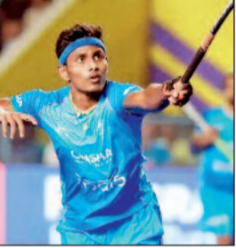
न्यूजीलैंड को नहीं होने दिया हावी

न्यूजीलैंड ने शुरूआती मिनटों में मिडफिल्ड में दबाव बनाने की कोशिश की लेकिन भारतीय डिफेंडर्स ने उन्हें मौका नहीं दिया। भारत को पहला मौका चौथे मिनट में पेनल्टी कॉर्नर के रूप में मिला जिस पर